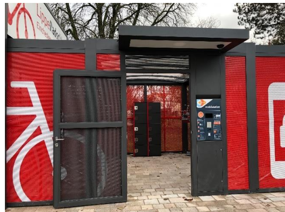
Bedienterminal und Schließfachschrank mit 9 Fächern und integrierten Ladesteckdosen