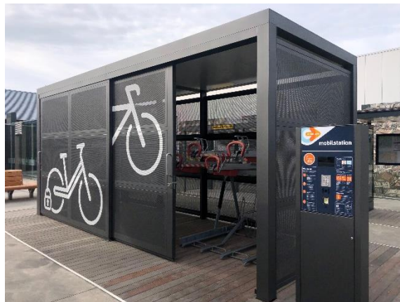
Sammelschließanlage Progress für 20 Fahrräder inkl. digitalem Buchungssystem und Dachbegrünung