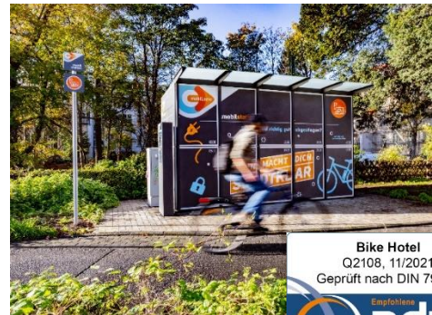
Fahrradgarage Bike Hotel®