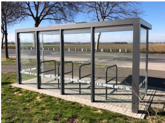
Fahrradüberdachung Progress für 10 Fahrräder inkl. Solarbeleuchtung und Dachbegrünung