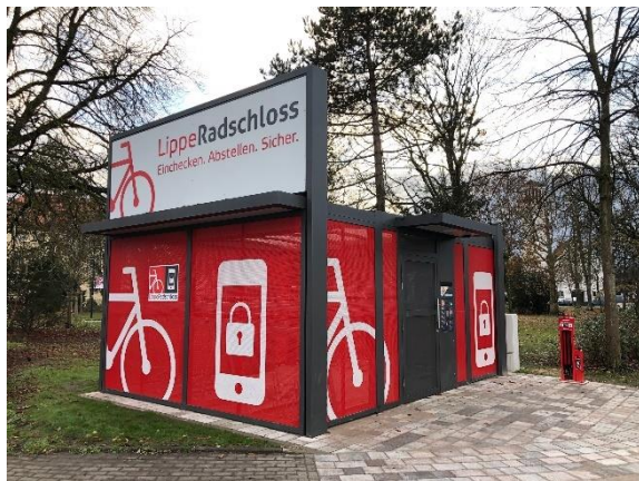
Fahrradabstellanlage Tectum für 36 Fahrräder (optional mit Dachbegrünung und Solarbeleuchtung)

Das offene Netzwerk des digitalen Buchungssystems der Conwee hat viele mögliche Anwendungsbereiche: Einzelstellplätze, Sammelschließanlagen, Fahrradparkhäuser oder bestehende Anlagen.