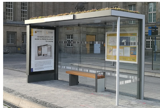
Wartehalle PROGRESS in Leipzig mit Dachbegrünung

Staatliche Förderungs- und Anrechnungsmöglichkeiten