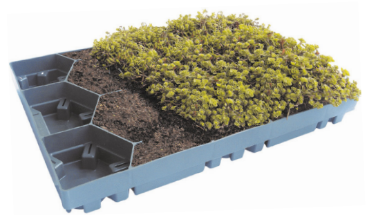
Dachbegrünung mittels Fertiggassetten